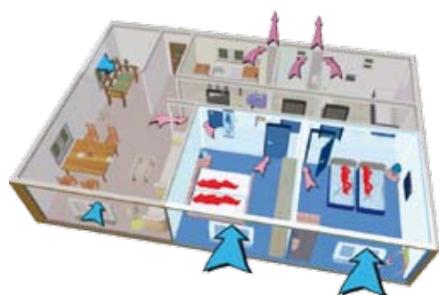
szellőztetési szükségletek éjszaka

Elmondható, hogy az AERECO szellőztetési rendszer légbevezető és légelvezető elemeinek automatikus működése megelőzve a páralecsapódásokat, annak összes károsító következményét, egy optimalizált, megfelelő komfortérzetet biztosító folyamatossá légcserét biztosít, melynek során jelentős fűtési energia megtakarítás érhető el.”