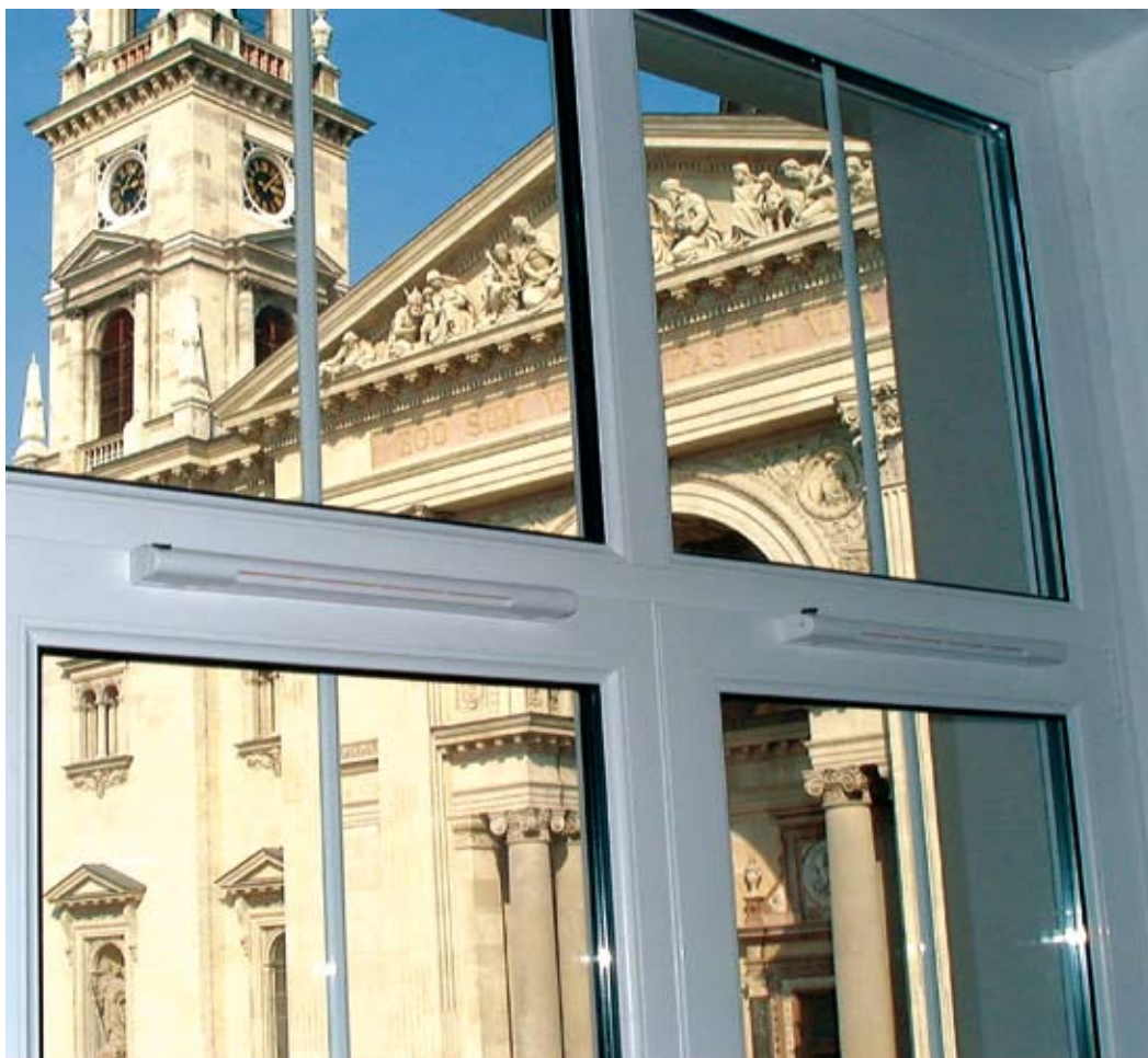
Nyílászáróba épített légbevezető elem

Elmondható, hogy az AERECO szellőztetési rendszer légbevezető és légelvezető elemeinek automatikus működése megelőzve a páralecsapódásokat, annak összes károsító következményét, egy optimalizált, megfelelő komfortérzetet biztosító folyamatossá légcserét biztosít, melynek során jelentős fűtési energia megtakarítás érhető el.”